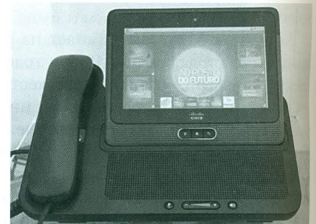
Информация, выводимая на экран планшета Cisco Cius на «Автозаправочной станции будущего Petrobras»

Cius работает под управлением ОС Android. Устройство представляет собой открытую платформу для совместной работы и обмена информацией, а особый форм-фактор и специализированные приложения обеспечивают возможность получения и предоставления доступа